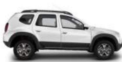
Vehículo tipo Camión Liviano – Pesado – Camioneta