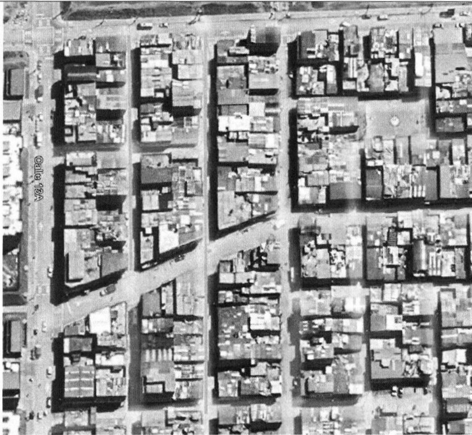
CALLE 13B ENTRE CARRERAS 19 Y 18Q, BARRIO PRADO VEGAS CALLE 14 ENTRE CARRERAS 19 Y 18H, BARRIO PRADO VEGAS