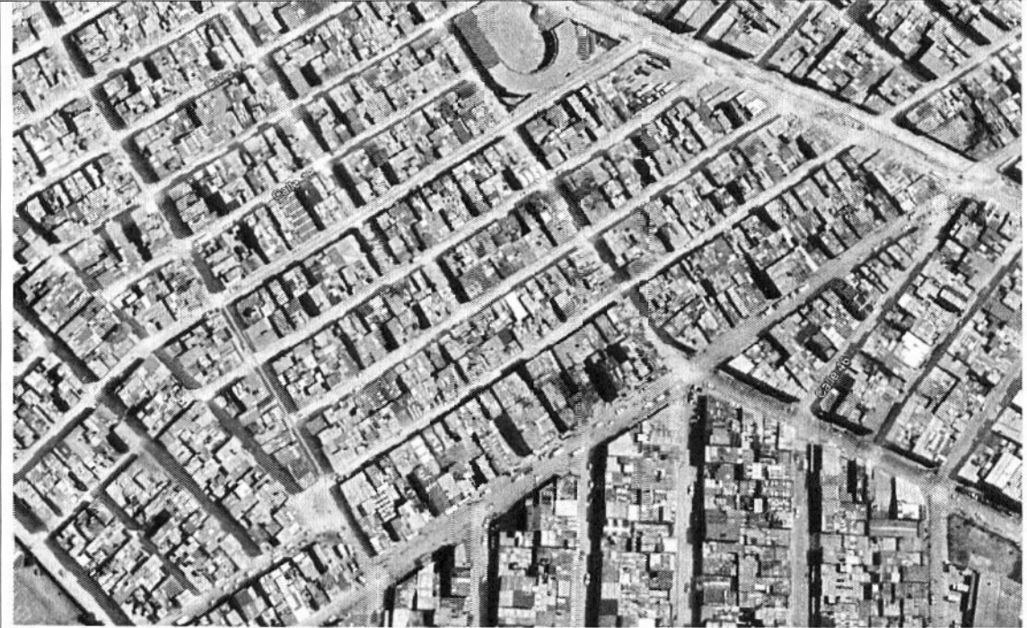
DE LA TRANSVERSAL 12A Y 13ª TRANSVERSAL 13 DESDE DIAGONAL 42 HASTA TRANSVERSAL 20