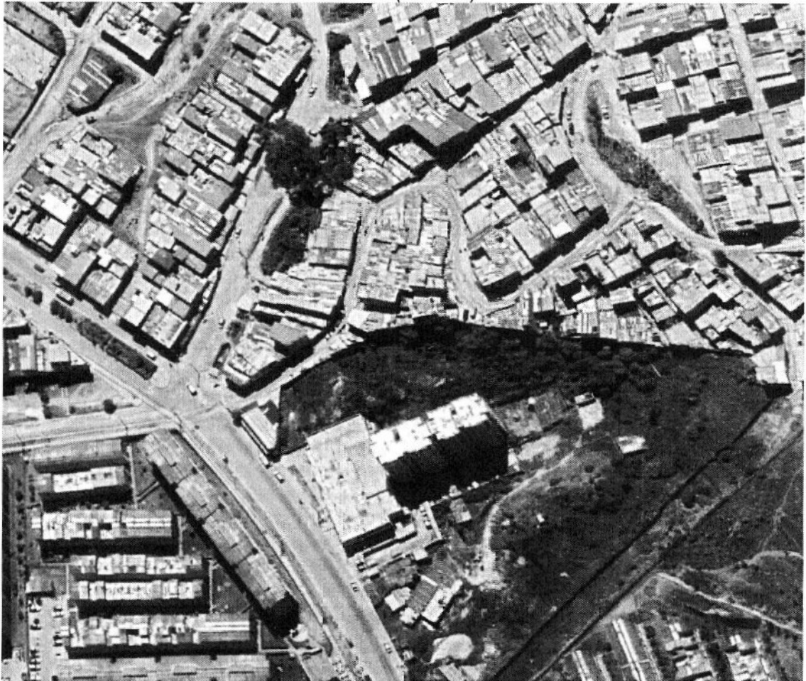
12) CALLE 43 G CR 9 ESTE A CR 12 A ESTE BARRIO LA ESPERANZA VILLA SANDRA