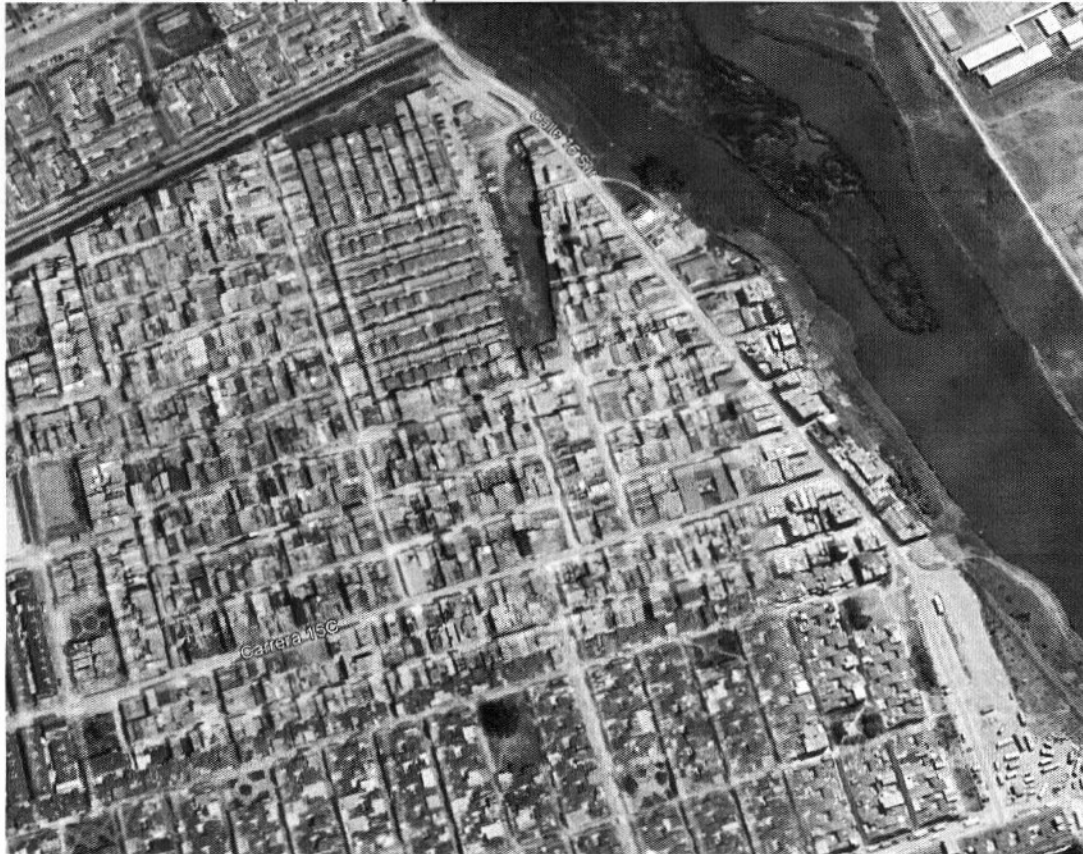
ENTRE CARRERAS 14 Y 16, BARRIO VILLA LUZ CARRERA 15C ENTRE CALLES 21C SUR Y 16 SUR, BARRIO VILLA LUZ