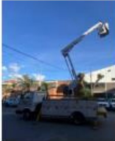
Vehículo tipo Liviano