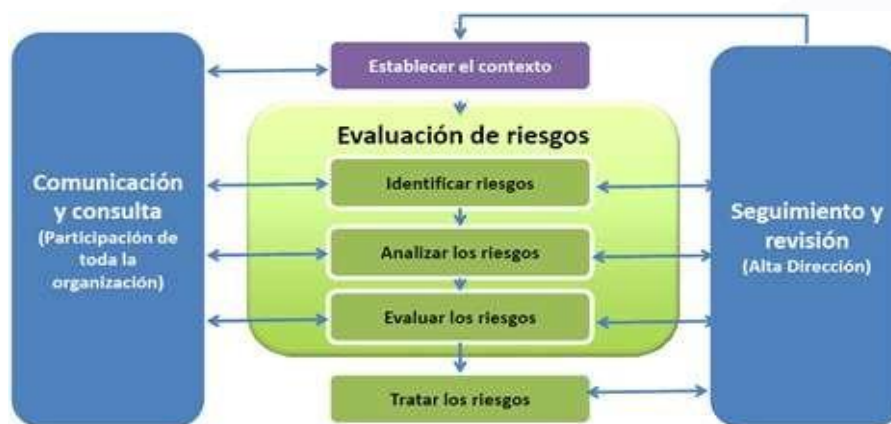
Proceso Gestión del Riesgo ISO 31000

Se implementará una metodología de Gestión de Riesgos de Seguridad de la Información basada en la norma ISO 31000 y en la guía de Gestión del Riesgo Seguridad y Privacidad de la Información de MinTic, como se ilustra a continuación.